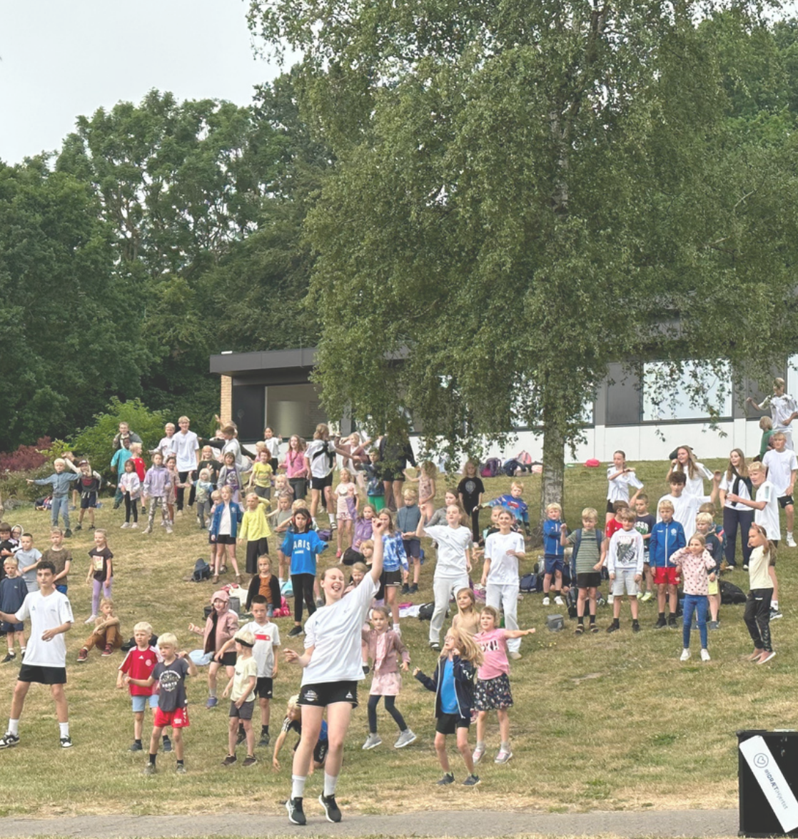
Glade SFO børn som glæder sig til at blive undervist af juniorkursister